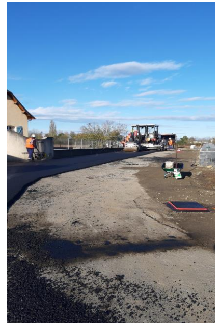
GOUDRONNAGE DES RUES