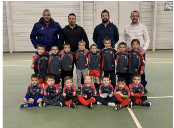
les – de 6 ans