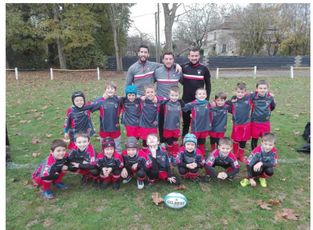
les – de 8 ans