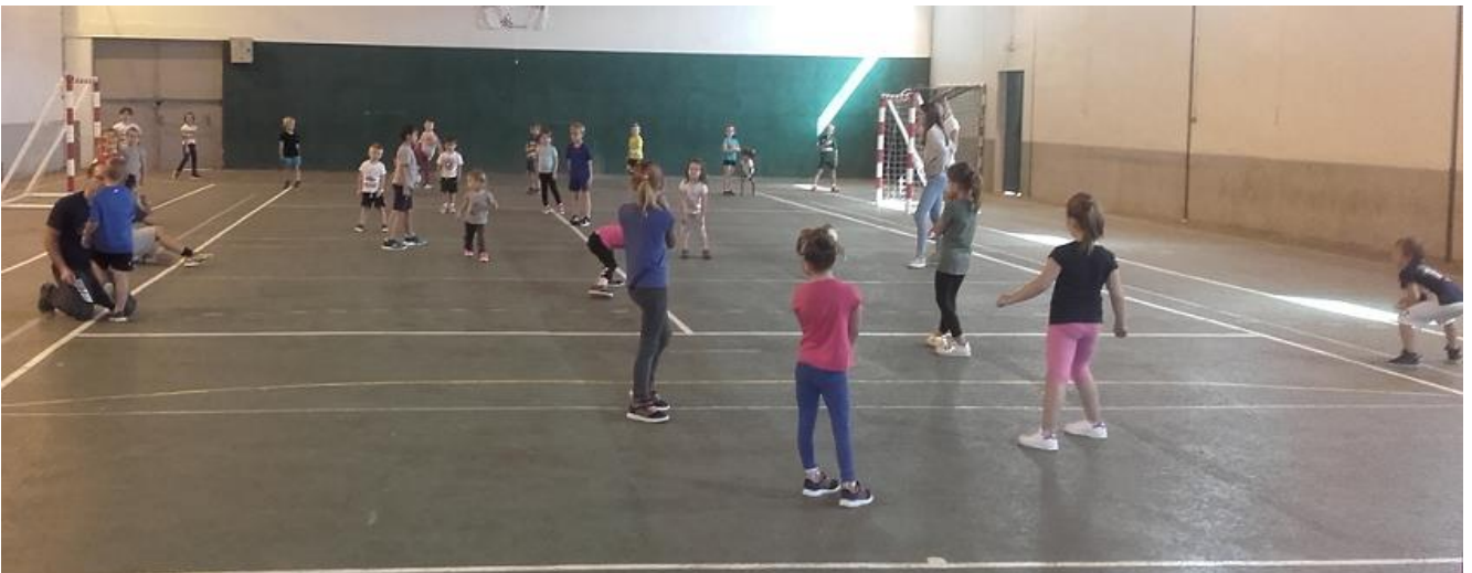
La salle de Louey fait le plein le samedi en baby et -9.

Vous pouvez nous rejoindre, pour tous renseignements, merci de contacter le 📞 06 21 50 77 63.