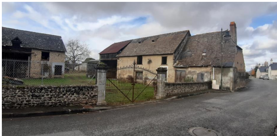
LA GRANGE LACAZE AVANT TRAVAUX